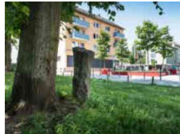
Platz der 11 Frauen