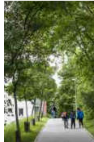
Fußweg am Königstor

Entstanden ist ein moderner Boulevard mit breiten Bürgersteigen, barrierefreien Haltestellen und mehr als 70 neuen Amber-Bäumen, die allerdings nicht zum Werk Beuys' gehören. Sie stehen für den Wandel in der heutigen Stadt- und Verkehrsplanung. Für die Modernisierung der bedeutenden Verkehrsachse erhielt Kassel den Deutschen Verkehrsplanungspreis. Vor der Neugestaltung war dieser Bereich der Friedrich-Ebert-Straße ein weitgehend pflanzenloser autogerechter Raum, der den Planungen der 1950er-Jahre entsprungen war. Der Blick in Richtung Innenstadt bot ein trauriges Bild, während in der Friedrich-Ebert-Straße westwärts schon eine Allee aus Beuys-Bäumen mit geschlossenem Blätterdach gewachsen war.